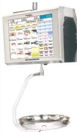
Suspendue (côté client avec afficheur TFT publicitaire)