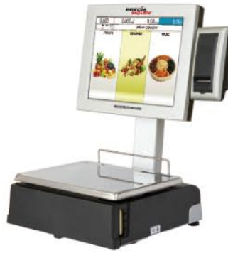
Double Corps (côté vendeur)