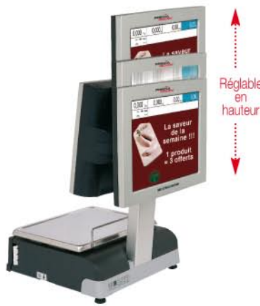
Double Corps (côté client avec afficheur TFT publicitaire réglable)