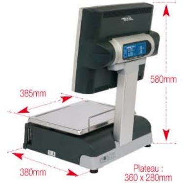
Double Corps (côté client, afficheur LCD)