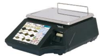
Comptoir ou colonne (côté vendeur)